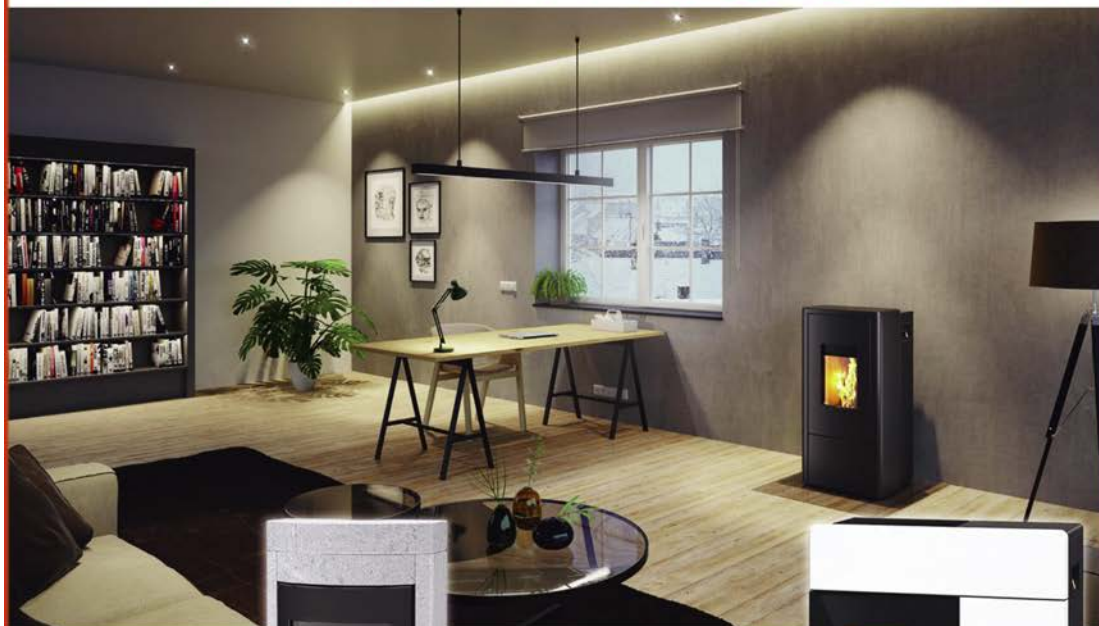
Poêles à bois